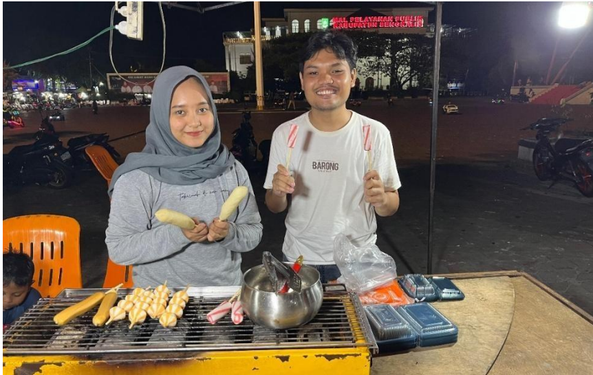
Gambar 3. Penyuluhan Tantang Manfaat Penerapan Sosial Media Bisnis dan Marketplace .

pendampingan, mulai dari pelatihan penggunaan media sosial hingga optimalisasi layanan pemesanan digital