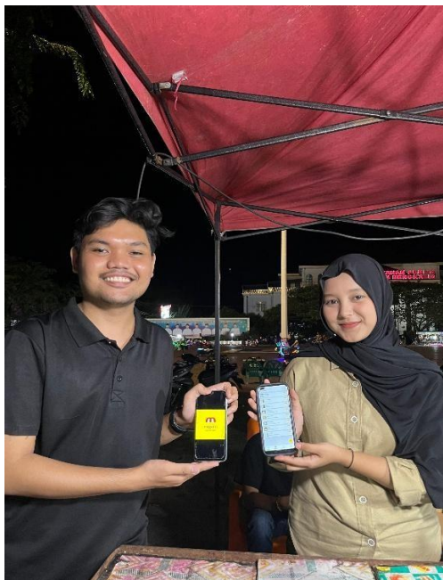
Gambar 4. Pembelajaran Bersama Pemilik Usaha dan Pembuatan Sosial Media dan Marketplace .

Dokumentasi kegiatan ditunjukkan pada Gambar 4 yang memperlihatkan kegiatan pembuatan sosial media bisnis seperti Instagram , TikTok , WhatsApp Business . Dan pembuatan marketplace di aplikasi Maxim . Pada kegiatan ini dilakukan pendampingan untuk memahami dasar berinteraksi di social media dan penerimaan pesanan di aplikasi maxim .