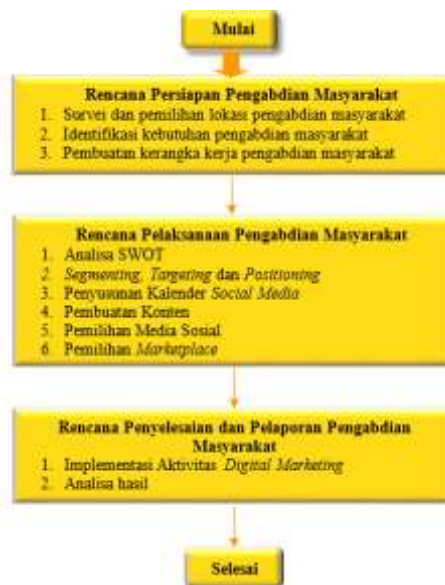
Gambar 1. Bagan Alir Metode dan Proses Penyelesaian Pengabdian Masyarakat

Metode dan proses penyelesaian pengabdian masyarakat ini dilakukan dalam 3 tahap