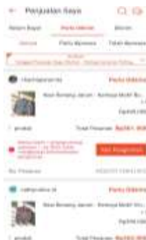
Gambar 3. Pembelian Produk di Marketplace Shopee

Kegiatan Pengabdian kepada Masyarakat ini telah dilaksanakan sesuai dengan tahapan yang telah direncanakan sejak awal, yaitu mulai dari analisis kebutuhan mitra hingga implementasi strategi digital marketing pada usaha “Emdee.style”. Dokumentasi kegiatan ditunjukkan pada Gambar 3 yang memperlihatkan jalannya proses pendampingan, mulai dari pelatihan penggunaan media sosial hingga optimalisasi layanan pemesanan digital di marketplace Shopee.