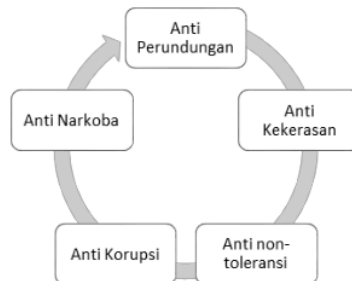
Gambar 2.1. Isu strategis bagi mahasiswa baru

Pengabdian ini dilakukan pada saat kuliah perdana mahasiswa baru Stifera Semarang yang berkolaborasi dengan beberapa universitas, tujuannya adalah sebagai upaya pencegahan atas beberapa isu strategis dikalangan mahasiswa. Diantaranya: