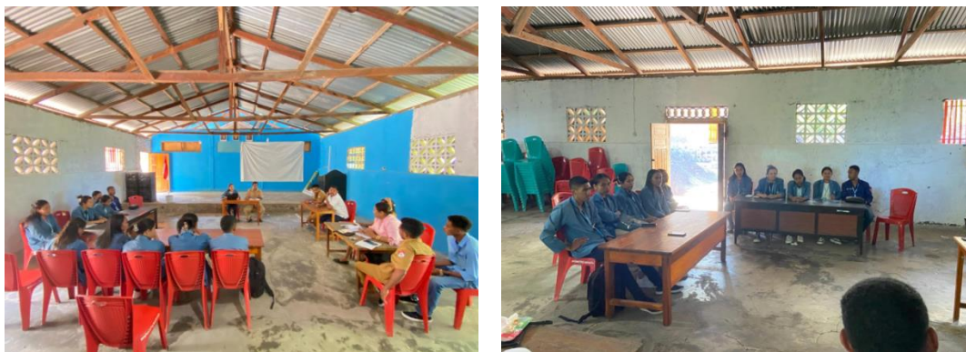
Gambar 1. Melakukan koordinasi dengan pemerintah Desa Warawutung terkait program sosialisasi anggaran desa yang akan dijalankan di tempat KKNT.

dilakukan di Kantor Desa Warawutung. Peserta KKNT dalam melakukan kegiatannya dibagi menjadi beberapa tahapan, secara deskriptif dapat dijelaskan sebagai berikut: