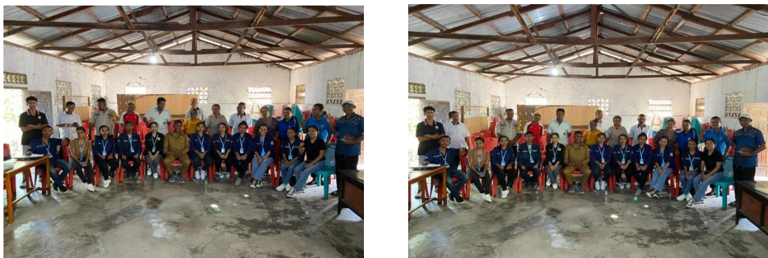
Gambar 3. Foto bersama Pemerintah Desa dan juga Masyarakat

dari anggaran desa itu sendiri. Dalam waktu yang sama juga Bapak Kaur Keuangan Desa sebagai pematri kedua dalam sosialisasi ini, menjelaskan secara terperinci terkait pengelolaan anggaran desa, mulai dari pemasukan serta pengeluaran anggaran desa itu sendiri. Pemateri juga ( Bapak Kaur Keuangan ) memberikan materi berdasarkan data yang ada, yang dimana data tersebut juga dilampirkan menggunakan proyektor. Sehingga sosialisasi yang kami lakukan berjalan dengan baik dan masyarakat senantiasa paham mengenai pengelolaan anggaran desa di Desa Warawutung tersebut.