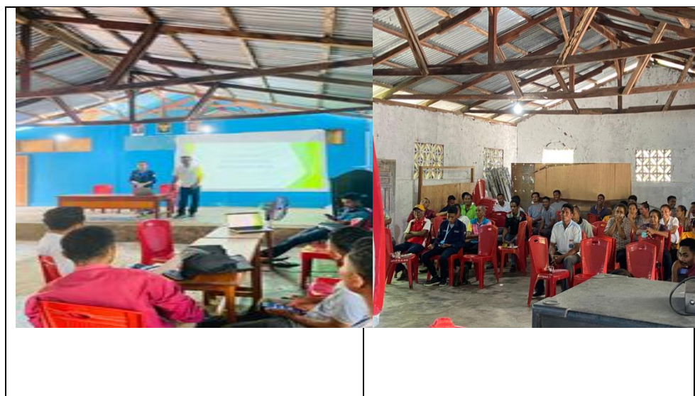
Gambar 2. Sosialisasi Pengelolaan Anggaran Desa

Pada Gambar 1, terlihat dimana adanya pertemuan antara Mahasiswa KKNT dengan Pemerintah Desa yang berlangsung di Aula Kantor Desa Warawutung, Kecamatan Nagawutung. Dalam pertemuan ini, Peserta KKNT dan Pemerintah Desa membahas dan memutuskan serta merencanakan semua hal tentang program kerja yang akan dilaksanakan.