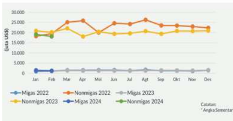
Gambar 2. Nilai Ekspor Migas dan Nonmigas Indonesia, Januari 2022–Februari 2024.

Berdasarkan provinsi asal barang, kontribusi ekspor terbesar berasal dari Jawa Barat dengan nilai US$5,95 miliar (14,95%), diikuti Kalimantan Timur sebesar US$4,17 miliar (10,47%), serta Jawa Timur sebesar US$3,80 miliar (9,55%). Hal ini menunjukkan bahwa wilayah dengan basis industri dan sumber daya alam yang kuat masih menjadi kontributor utama dalam kegiatan ekspor nasional.