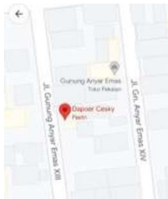
Gambar 3. Pin Lokasi Dapoer Cesky di Gmaps

Melalui pemasangan pin lokasi ini akan memberikan arahan yang jelas serta lokasi yang akurat di mana Dapoer Cesky berada. Pencarian yang lebih mudah serta akurat untuk menghindari adanya disinformasi tentang lokasi keberadaan usaha, khususnya untuk melakukan distribusi dan pengambilan produk untuk jasa ojek online.