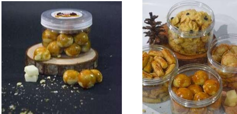
Gambar 2. Foto Produk Dapoer Cesky

memberikan citra lebih yang sesuai dengan produk yang dihasilkan. Berdasarkan hal tersebut, penulis melakukan foto produk seperti yang ada di bawah ini.