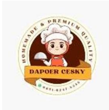
Gambar 1. Logo Dapoer Cesky

tidak adanya identitas yang jelas. Berdasarkan hal tersebut, penulis melakukan pembuatan logo seperti pada gambar di bawah ini.