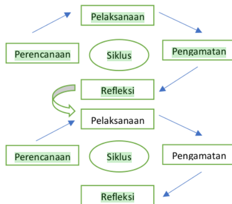
Gambar 1. Metode Penelitian

Penelitian ini merupakan penelitian tindakan kelas yang terbagi menjadi empat aspek utama, yaitu perencanaan, tindakan, observasi, dan refleksi. Secara umum, model penelitian ini dapat digambarkan sebagai berikut.