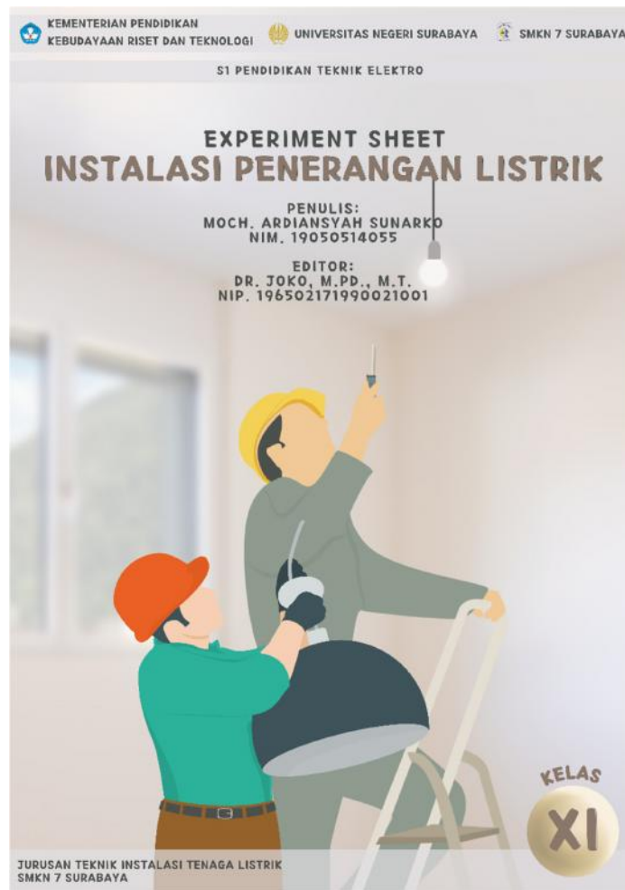
Gambar 1 Cover Depan Experiment Sheet

Terdapat 3 tampilan pada sampul experiment sheet, yang pertama adalah tampilan cover depan experiment sheet yang ditunjukkan pada gambar 1.