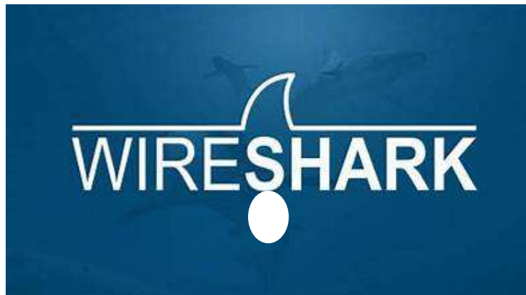
Gambar 2. Software Wireshark

Fungsionalitas Wireshark untuk Jaringan Wi-Fi pengguna dapat memantau dan menganalisis berbagai aspek jaringan Wi-Fi, termasuk melihat paket data yang dikirim dan diterima oleh perangkat dalam jaringan. Menganalisis protokol yang digunakan dalam komunikasi, seperti TCP/IP, HTTP, DNS, dll. Mendeteksi masalah jaringan, seperti lonjakan lalu lintas atau kebocoran keamanan. Menganalisis kinerja jaringan dan mengidentifikasi area yang membutuhkan perbaikan atau peningkatan (Roland Oktavianus Lukas Sihombing, 2013).