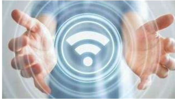
Gambar 1. Wireless Fidelity (Wifi)

Wireshark adalah sebuah software berbasis open-source yang digunakan untuk memindai dan menangkap trafik data pada jaringan internet. Axence net Tools merupakan software yang sangat handal, tool ini dipakai untuk mengukur, menganalisis performance network dan mendiagnosis masalah yang terjadi pada jaringan tersebut (Fajar Saputra, 2023).