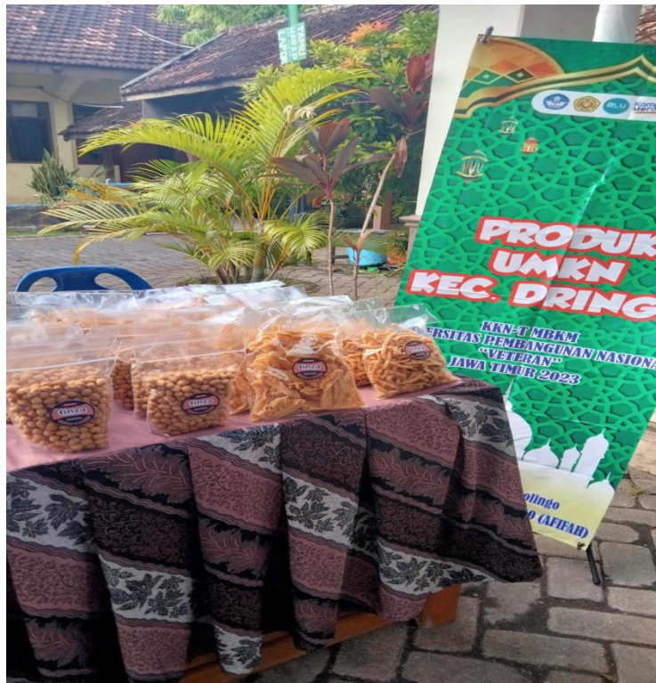
Gambar 4. Foto Produk UMKM Finza Cake and Cookies pada acara bazar FGD di kecamatan Dringu

yakni dengan menggunakan kemasan plastik tebal dengan menambah tempelan stiker logo kemasan yang telah dibuat di setiap produk.