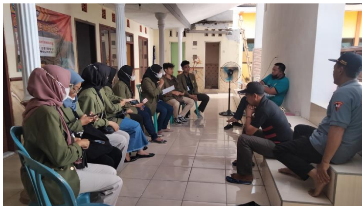
Gambar 1. Kegiatan FGD (Focus Group Discussion) bersama kepala desa dan perangkat

Mahasiswa KKNT-MBKM menganalisis terkait proses produksi serta kendala atau hambatan yang dialami selama menjual produk UMKM Finza Cake and Cookies.