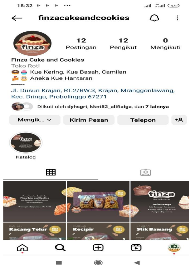
Gambar 5. Akun instagram Finza Cake and Cookies

Tahapan selanjutnya dalam mempromosikan UMKM Finza Cake and Cookies secara efektif adalah mahasiswa memanfaatkan media sosial untuk memaksimalkan penjualan menggunakan fitur-fitur di media sosial seperti promosi di Instagram, website, dan Instagram Stories. Sebuah platform e-commerce berusaha menjadi solusi untuk mempromosikan suatu produk sehingga menjangkau khalayak yang lebih luas dan mendorong penjualan dengan menggunakan salah satunya dalam promosi produknya. Langkah pertama bagi mahasiswa adalah memperkenalkan dan menjelaskan platform media sosial seperti Instagram kepada para pelaku UMKM. Mahasiswa langsung membantu proses pendaftaran akun Instagram resmi atas nama UMKM terkait setelah ibu Arik selalu pemilik usaha UMKM Finza Cake and Cookies mendapatkan pemahaman tentang media sosial Instagram.