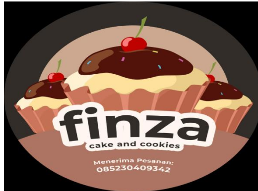
Gambar 3. Logo UMKM Finza Cake and Cookies

Membuat logo adalah langkah awal dalam branding. Keinginan UMKM diperhitungkan saat membuat logo, dan kemudian diubah secara kreatif untuk membuat logo yang istimewa dan indah. Karena UMKM Finza Cake and Cookies sering meminta penyesuaian, maka pembuatan logo membutuhkan waktu yang cukup lama.