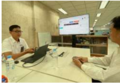
Gambar 4.3 Proses Monitoring Dan Evaluasi Bersama Mentor

Monitoring dan evaluasi berkelanjutan dilakukan secara rutin untuk memastikan efektivitas dari perubahan yang diterapkan pada dokumen instruksi kerja. Proses ini melibatkan pengumpulan data dari berbagai sumber, analisis data, dan diskusi mendalam dengan mentor dan tim untuk mengidentifikasi tren serta memutuskan tindakan lanjutan yang perlu diambil. Tujuannya adalah untuk memonitor implementasi instruksi kerja yang telah diperbaiki, mengumpulkan data untuk evaluasi lebih lanjut, dan mengidentifikasi area yang memerlukan tindakan korektif. Selama sesi evaluasi, penulis juga membuat catatan dan dokumentasi tentang umpan balik yang diterima serta rencana tindakan yang akan diambil selanjutnya. Proses ini penting untuk memastikan bahwa dokumentasi instruksi kerja terus diperbaharui sesuai dengan kebutuhan perusahaan dan praktik terbaik yang berlaku.