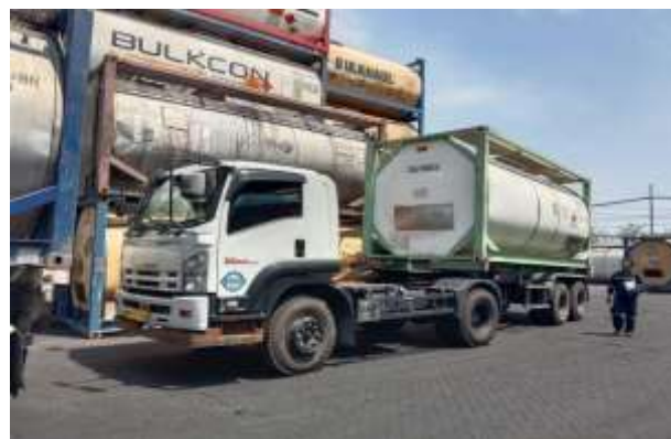
Gambar 3.3 Truk dan Isotank PT Galuh Protank Logistics

Berfokus pada penyediaan penyewaan transportasi untuk mengangkut angkutan cair dalam jumlah besar yang disebut isotank . Berkapasitas 25.000 liter dan di impor dari Jerman membuat isotank ini memiliki kualitas yang lebih baik dari buatan China, karena perusahaan ini mengedepankan keamanan, kualitas pengiriman, serta teknologi terkini untuk memenuhi kebutuhan industri yang sensitif terhadap keamanan dan keselamatan. Bahan yang dipakai isotank adalah stainless steel atau aluminium yang kuat dan mampu menahan korosi dengan perawatan yang terjaga menjadikannya sangat cocok untuk pengiriman bahan kimia cair dalam jumlah banyak. Penyewaan unit ini biasanya memiliki ketentuan jangka waktu minimal satu bulan penyewaan dengan pilihan satuan atau lengkap dengan truk pengangkutnya. Truk yang digunakan juga memiliki spesifikasi khusus untuk mengangkut muatan cair yang biasa digunakan untuk perjalanan darat dari satu tempat ke tempat yang lain. Pelanggan juga dapat menyewa truk saja tanpa isotank dari perusahaan bila diperlukan.