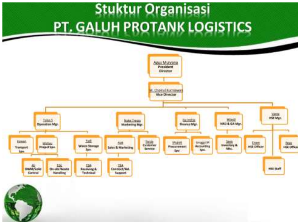
Gambar 3.2 Struktur Organisasi PT Galuh Protank Logistics

Berdasarkan struktur organisasi di atas, terdapat tugas dan kewenangan dari masing-masing jabatan yang ada di PT Galuh Protank Logistics, adapun tugas dan kewenangan adalah sebagai berikut.