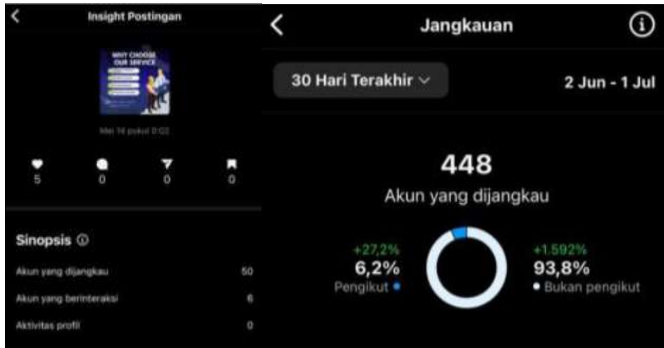
Gambar 4.2 Hasil Insight Pemasaran Digital PT. Galuh Protank Logistics