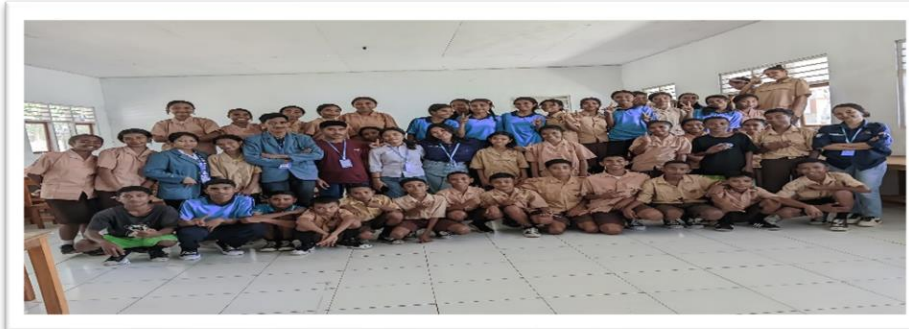
Foto 3 Siswa/i SMP 3 Nagawutung