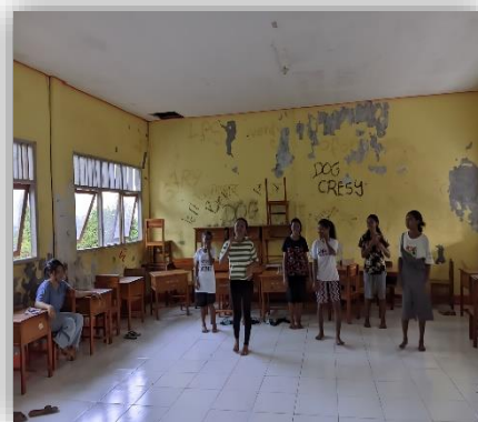
Foto 4 Latihan Puisi Dan Latihan Seni Tari(Tarian Budaya Flores Timur)