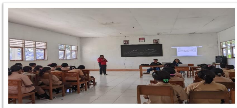
Foto 1 penerimaan Sekaligus pengenalan pemaparan oleh guru Bahasa Indonesia SMP 3 Nagawutung

Adapun yang menjadi kekurangan dalam kegiatan pelatihan seni dan budaya ini seperti kurangnya perlengkapan yang dibutuhkan, sehingga beberapa kegiatan yang menjadi dasar kurang diperhatikan. Hal ini juga tidak menjadi permasalahan karena begitu antusiasnya siswa/i dalam mengikuti kegiatan.