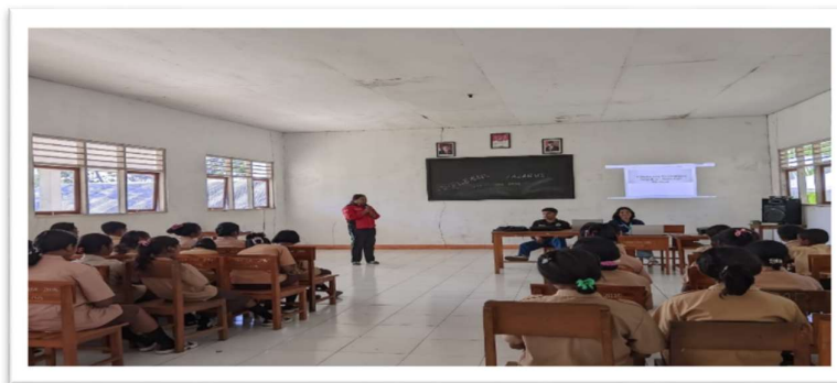
Foto 1 penerimaan Sekaligus pengenalan pemateri oleh guru Bahasa Indonesia SMP 3 Nagawutung

Adapun yang menjadi kekurangan dalam kegiatan pelatihan seni dan budaya ini seperti kurangnya perlengkapan yang dibutuhkan, sehingga beberapa kegiatan yang menjadi dasar kurang diperhatikan. Hal ini juga tidak menjadi permasalahan karena begitu antusiasnya siswa/i dalam mengikuti kegiatan.