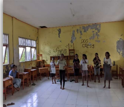
Foto 4 Latihan Puisi Dan Latihan Seni Tari(Tarian Budaya Flores Timur)