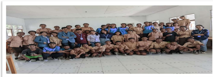
Foto 3 Siswa/i SMP 3 Nagawutung