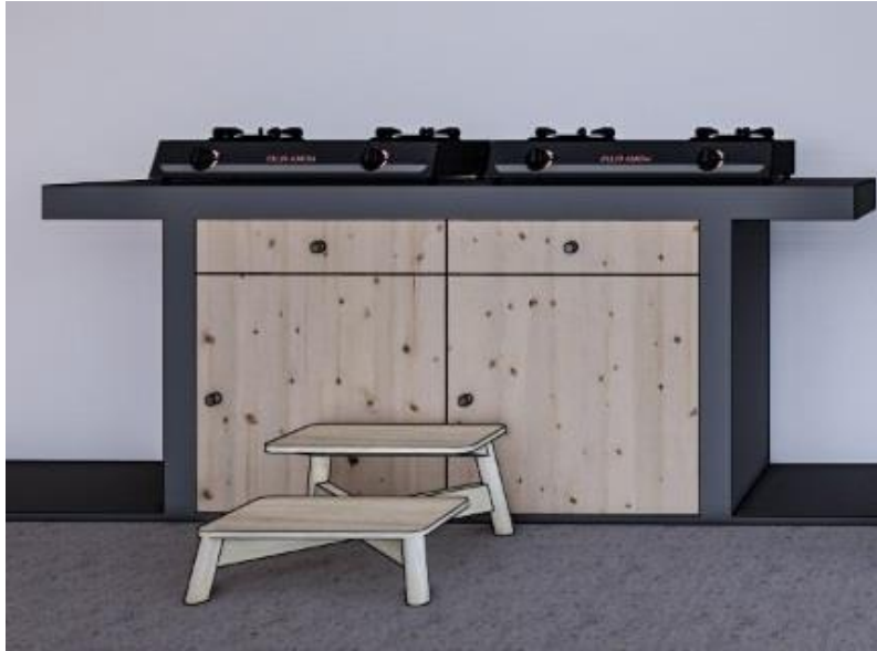
Gambar 2. Desain 3 dimensi dapur lansia