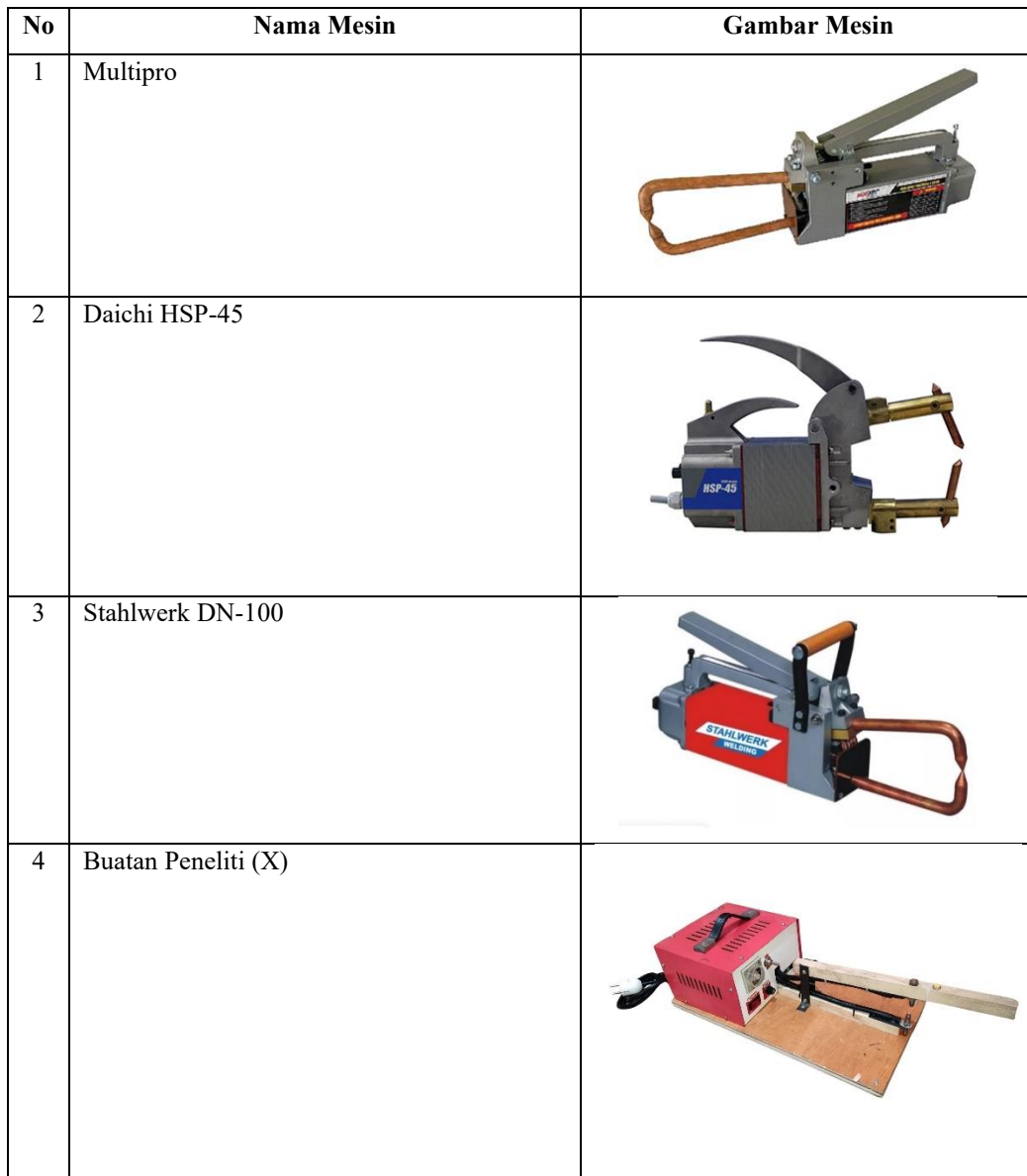
Tabel 3. Jenis-Jenis Mesin Spot Welding